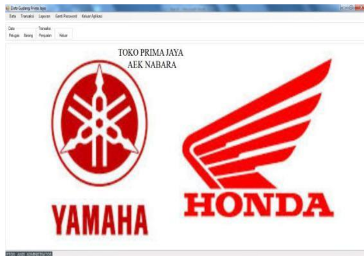
Gambar 4.2 Tampilan Form Menu Utama