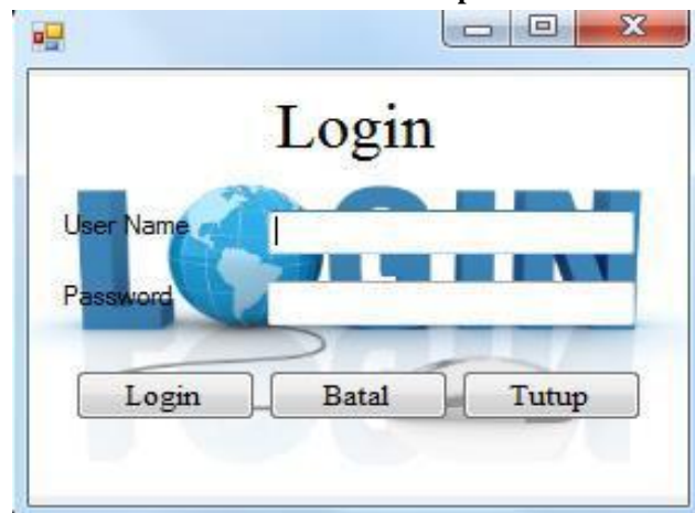
Gambar 4.1 Tampilan Form