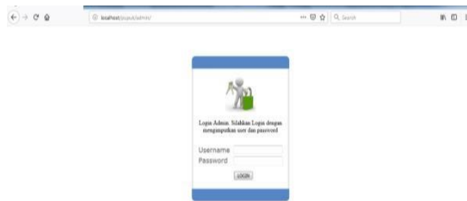
Gambar 6. Login Admin